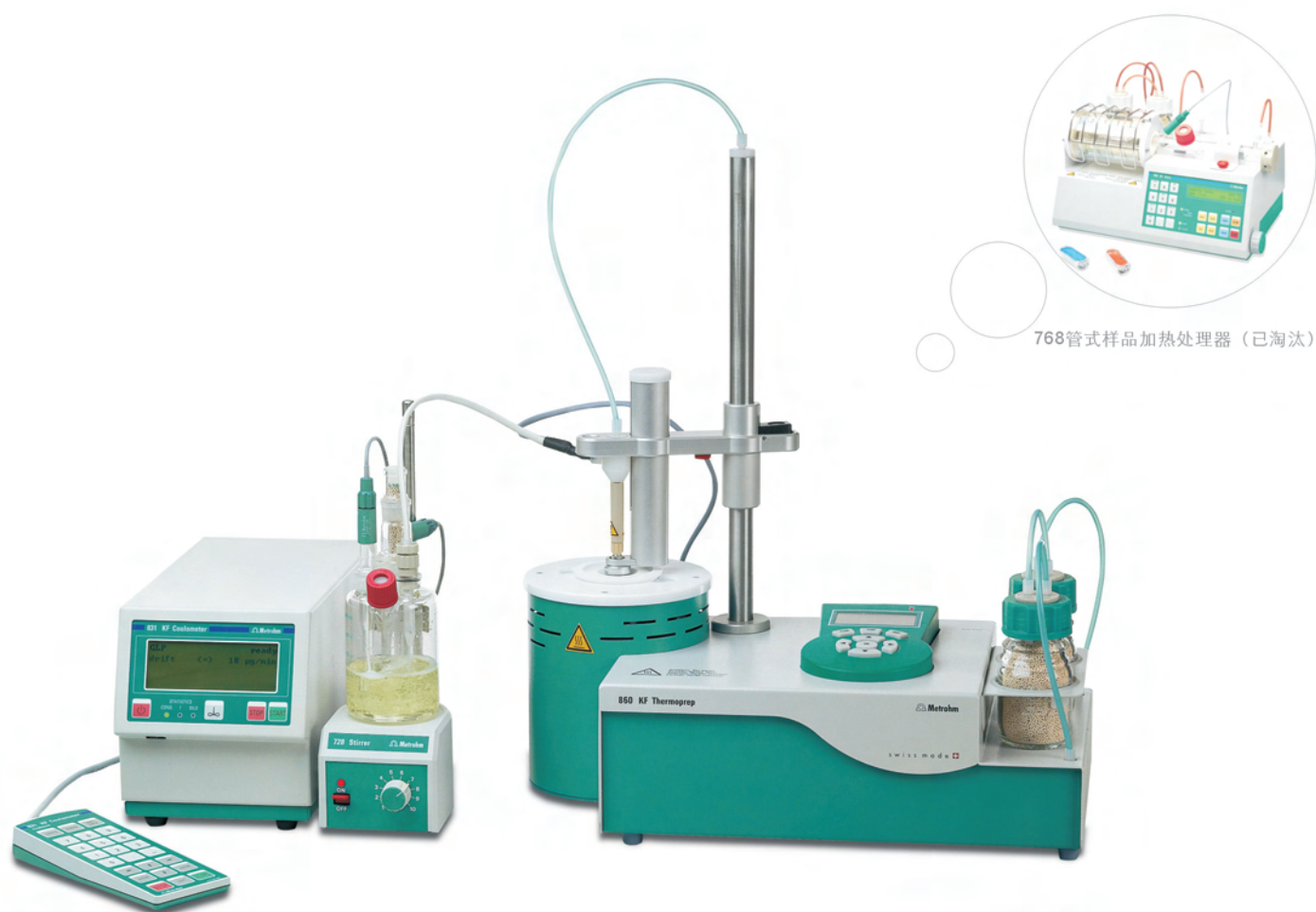
768管式样品加热处理器（已淘汰）

卡尔费休法分为库仑法与容量法。与容量法不同，库仑法卡氏反应中的碘直接由发生电极电解产生，再利用电解碘所需的电量与碘之间的定量关系计算出样品的含水量。卡氏库仑法是绝对测定，无需测定滴定度。