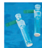
可使用有隔膜或无隔膜发生电极

无隔膜：使用单组分卡氏试剂，电极无需日常维护 有隔膜：适用范围广，尤其适用于含醛酮体系、相对含水量在100ppm以下和低电导样品