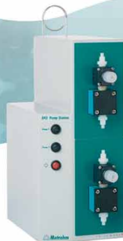
Pump Station 843 (Membran)