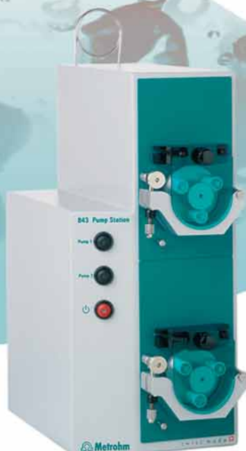
Pump Station 843 (Peristaltik)