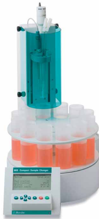
Compact Sample Changer – Automation auf kleinstem Raum

Da Laborplatz teuer und rar ist, benötigt der kompakte Probenwechsler nur die Standfläche einer handelsüblichen Analysenwaage.