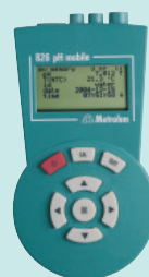
826 pH mobile