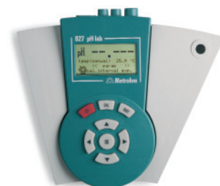
827 pH lab