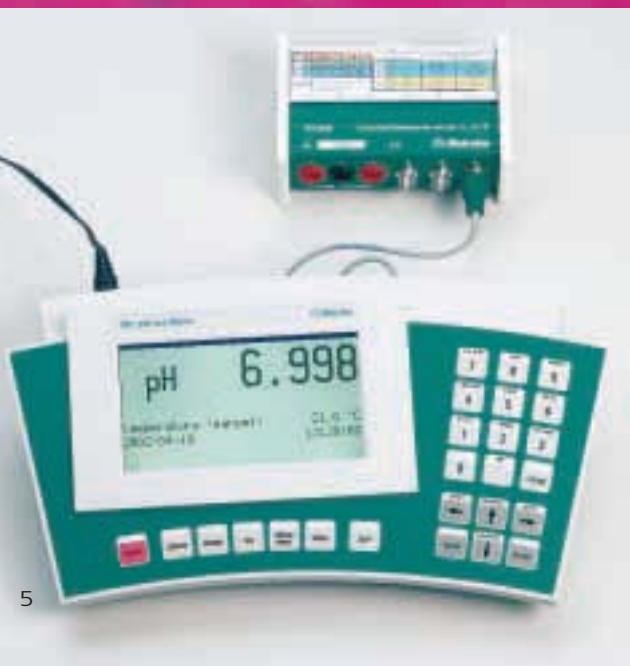
Control del valor de pH indicado por el pH-Ionómetro 781 con la Referencia calibrada 767.

La Referencia calibrada 767 le ofrece la posibilidad de controlar su aparato de medida en el trabajo normal y, por lo tanto, dentro de métodos elaborados. Ello presenta la ventaja de que también las secuencias operacionales y los métodos empleados son sometidos a prueba.