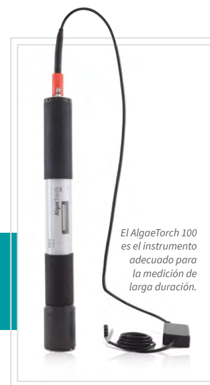
El AlgaeTorch 100 es el instrumento adecuado para la medición de larga duración.